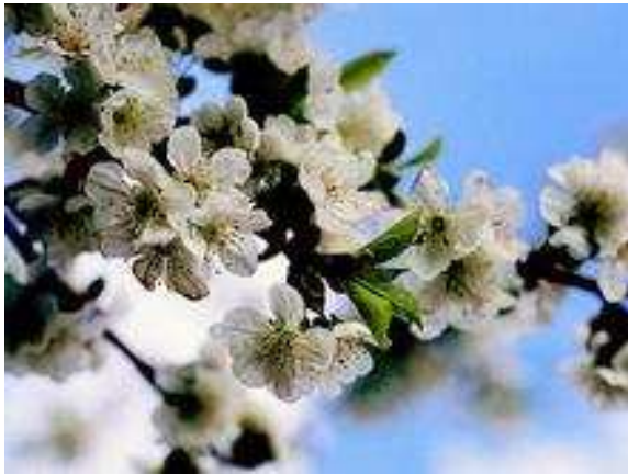
Die Vogelkirsche ( Prunus avium L.) ist der Baum des Jahres 2010.

Die Vogelkirsche ist der Baum des Jahres 2010. Der Baum mit den schneeweißen Blüten begleite die Menschen seit Jahrtausenden, sei heute aber nur noch selten zu finden, teilte das Kuratorium Baum des Jahres am Donnerstag in Berlin mit.