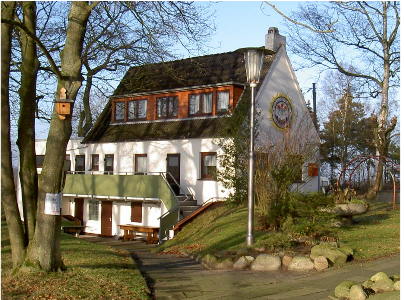
Unser „Kleines Haus“

Verband für Umweltschutz, sanften Tourismus, Sport und Kultur