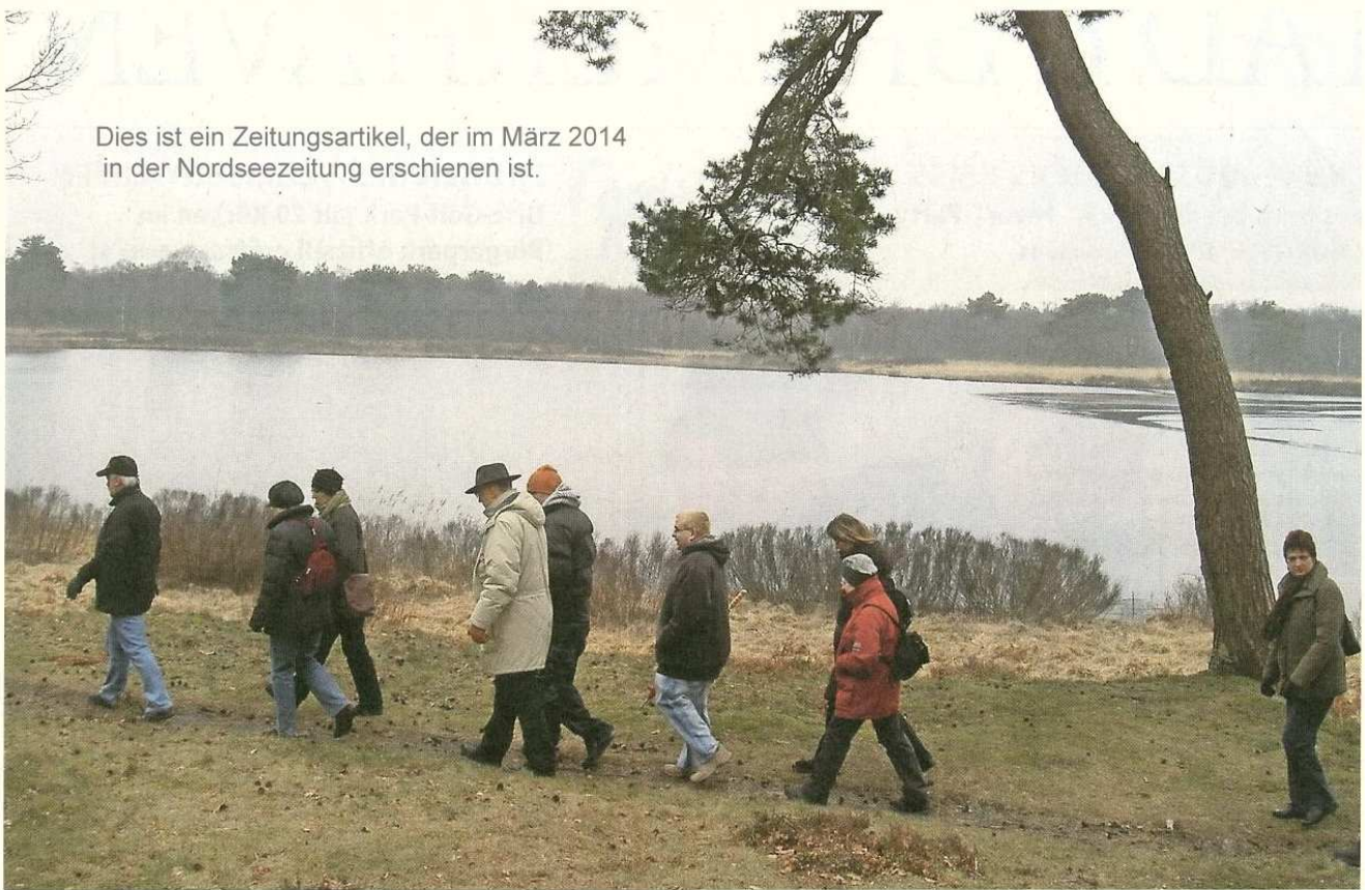
Ein Ziel ins Auge fassen und einfach loslaufen – das ist das Credo der Wandergruppe der Naturfreunde Bremerhavens.

Dies ist ein Zeitungsartikel, der im März 2014 in der Nordseezeitung erschienen ist.