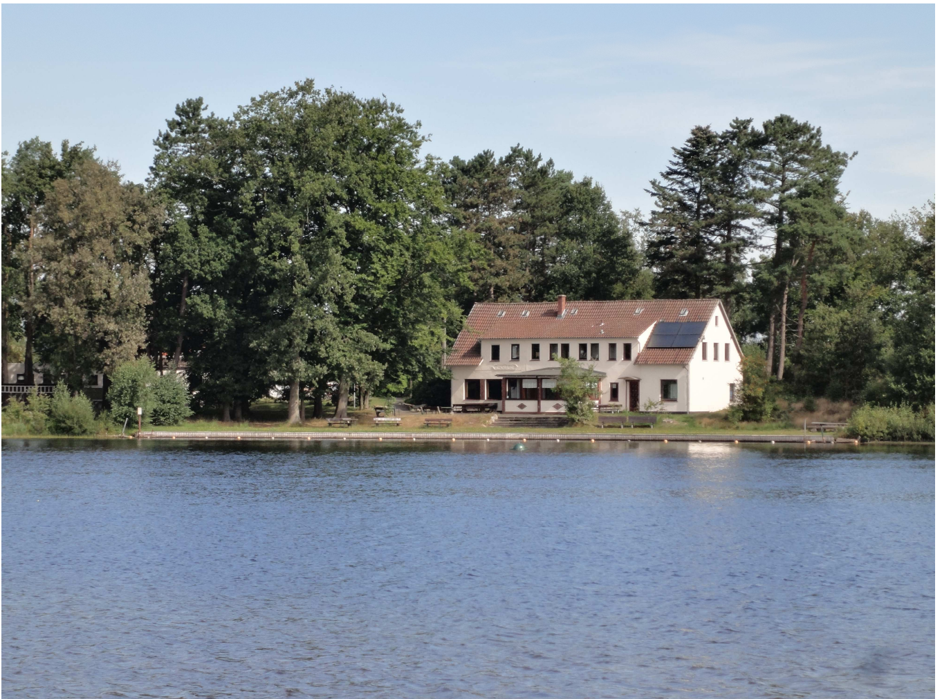
Am Wollingster See

Verband für Umweltschutz, sanften Tourismus, Sport und Kultur