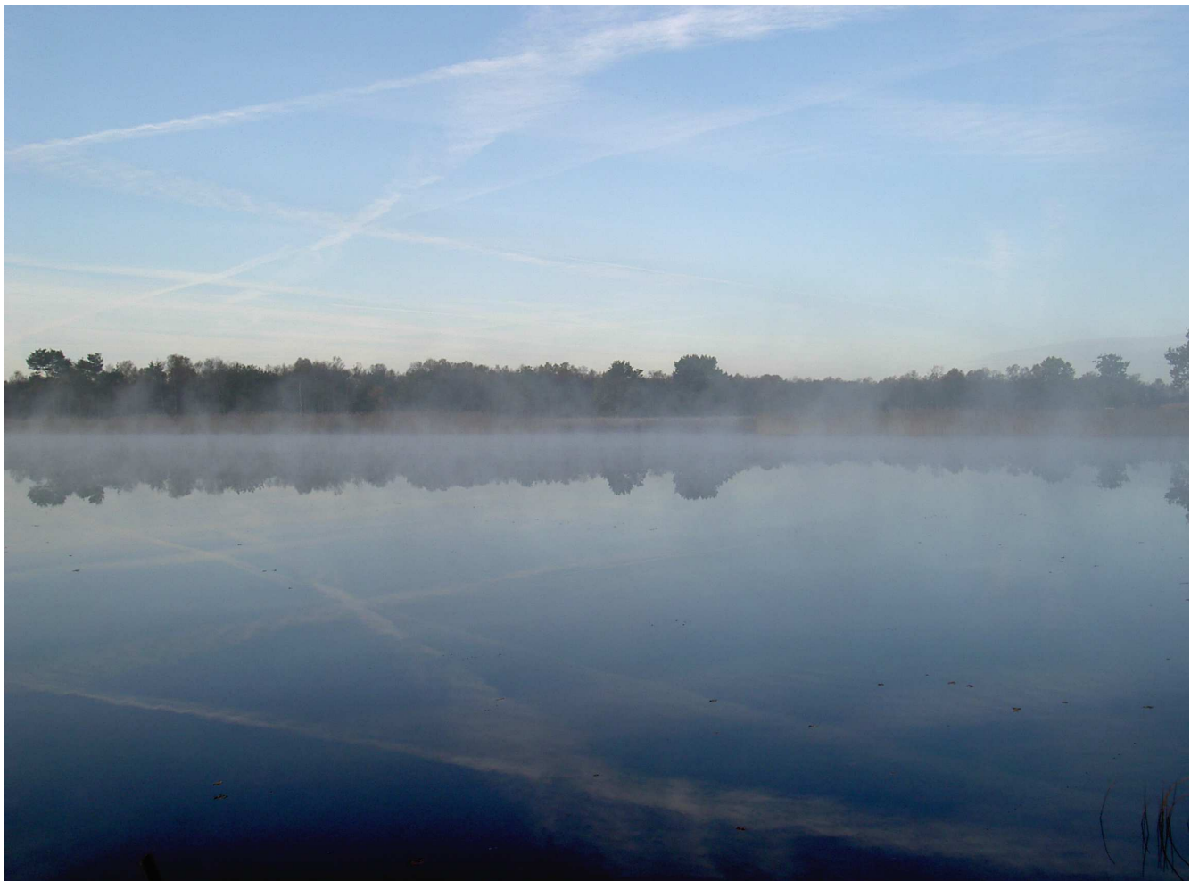
„Spiegelung im Wollingster See“

Verband für Umweltschutz, sanften Tourismus, Sport und Kultur