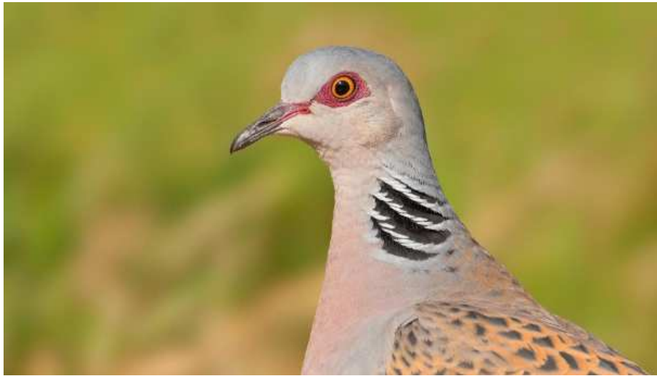
Turteltaube: Der Vogel gilt als Symbol der Liebe.

Sie ist ein Symbol der Liebe. Doch ihr Bestand ist in den letzten Jahren stark eingebrochen: Die Turteltaube. Jetzt hat die Vogelart einen ganz besonderen Titel erhalten.