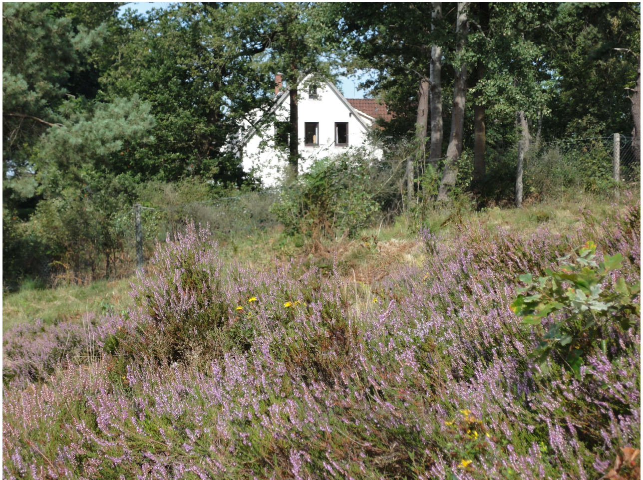
Am Wollingster See

Verband für Umweltschutz, sanften Tourismus, Sport und Kultur